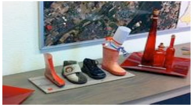
Op twitter schreef Testroote dat hij het werkje een prominente plek in zijn werkkamer heeft gegeven zodat hij er elke dag aan herinnerd wordt.

Armoede kan veel oorzaken hebben maar armoede is geen keuze en men komt er ook niet snel vanaf zonder de juiste hulp. Ondanks de crisis zijn wij een rijk land en een rijke gemeente, als we eerlijker delen hoeft in de toekomst geen kinderschoen meer leeg te staan. Laat de kinderen niet de rekening krijgen van de crisis.