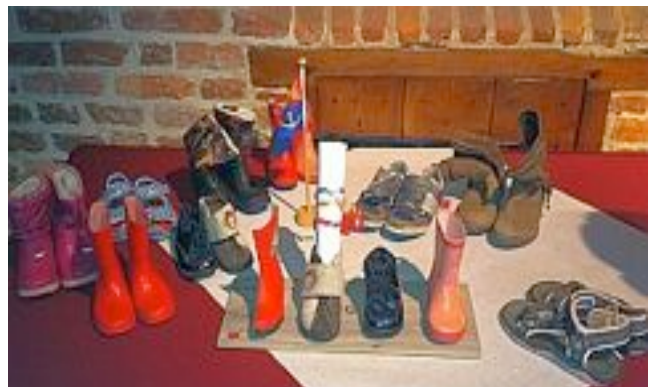
Enkele van de gedoneerde kinderschoenen uitgesteld in het stadhuis met op de voorgrond het kunstwerkje van 3,5 schoenen met de petitie opgerold in een schoentje.

De petitie voor meer aandacht aan kinderarmoede werd samen met een symbolisch werk van drie-en-een-halve kinderschoen ( elke schoen staat voor duizend kinderen ) samen met een deel van de ingezamelde kinderschoenen vandaag aangeboden op het stadhuis van Venlo aan wethouder Testroote.